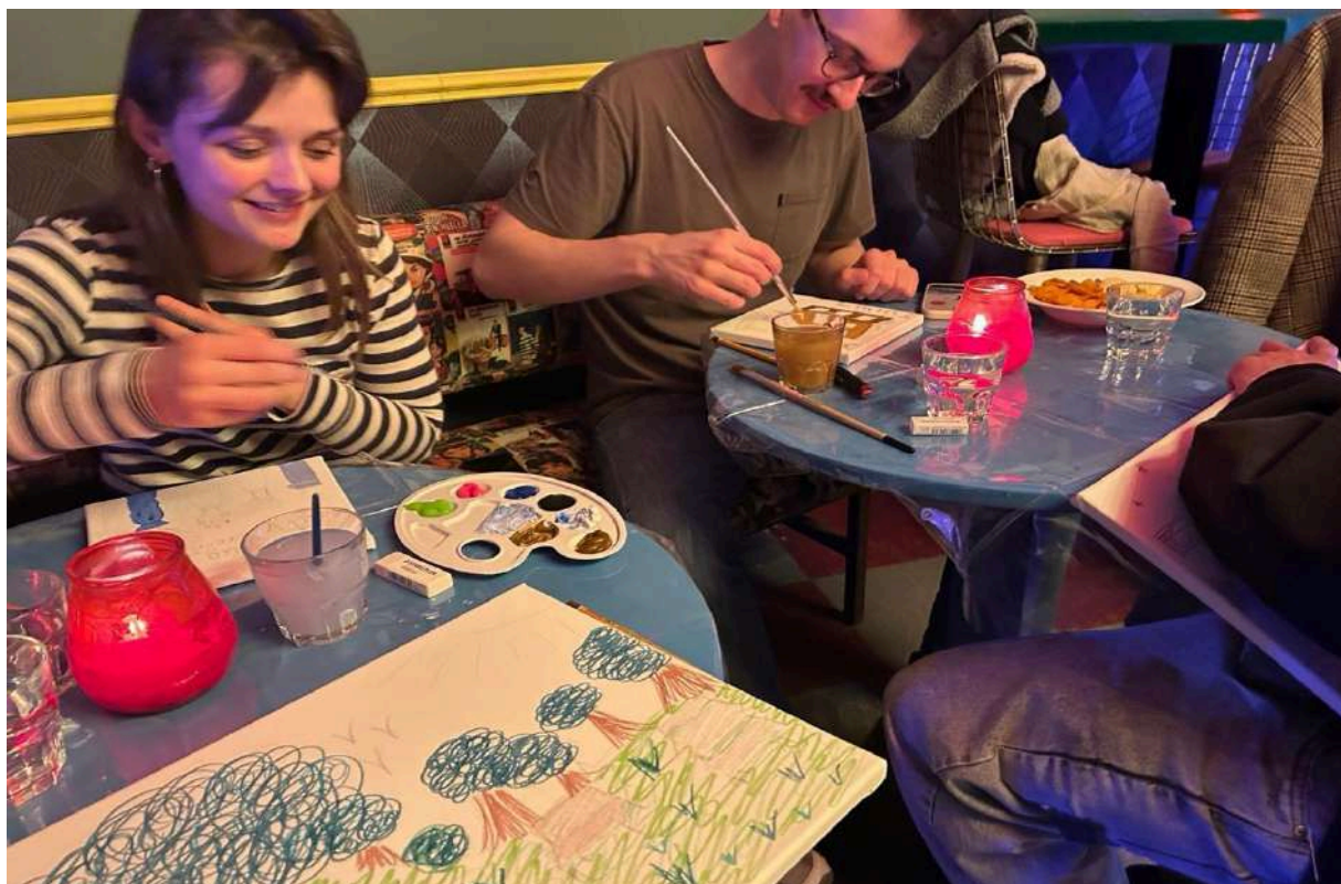
Afbeelding: Evenement Sketch Your Future in de Nar