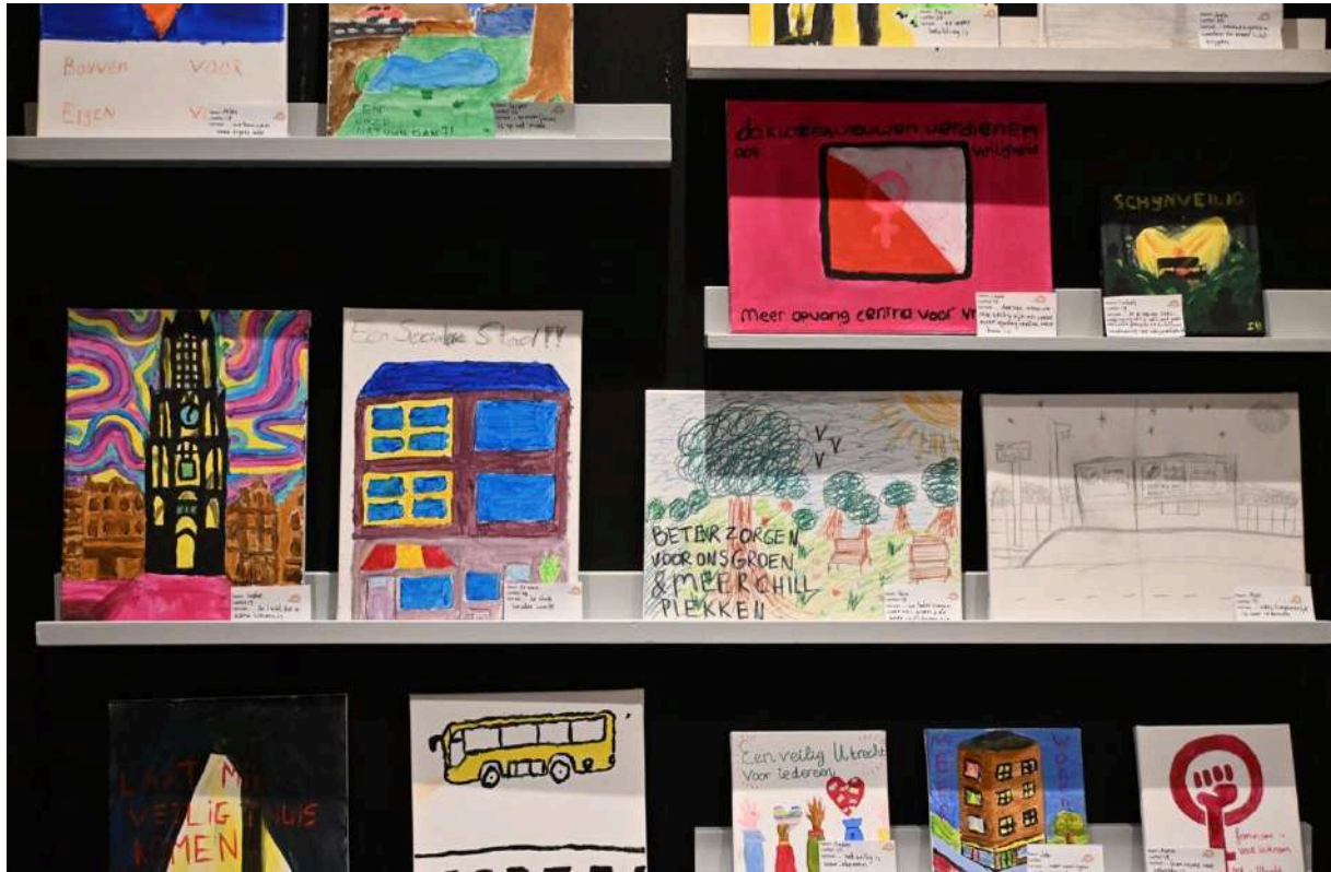
Afbeelding: Het grote verkiezingsdebat in TivoliVredenburg